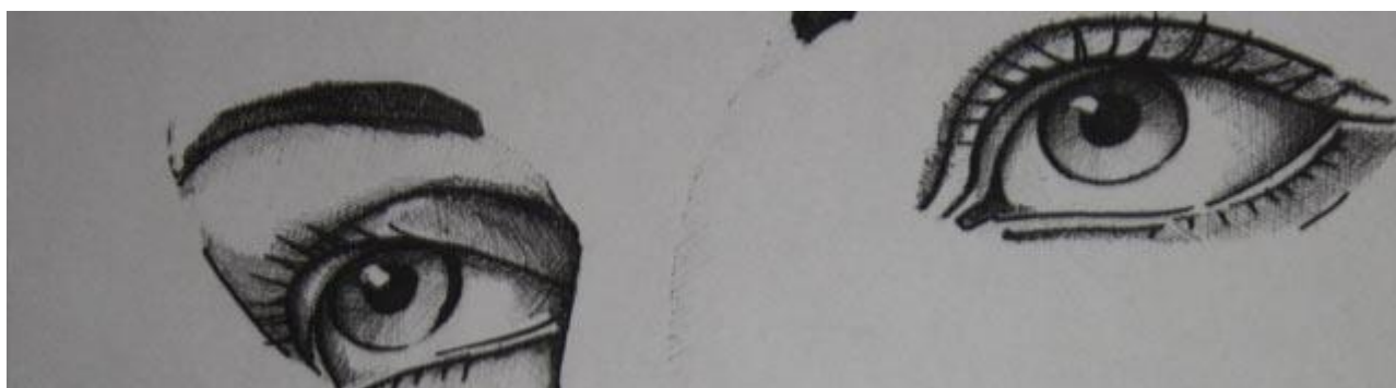
La mirada femenina , de Alejandro Stock